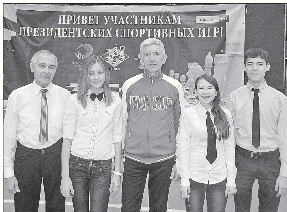
Сборная Самарской области по шахматам на Президентских играх