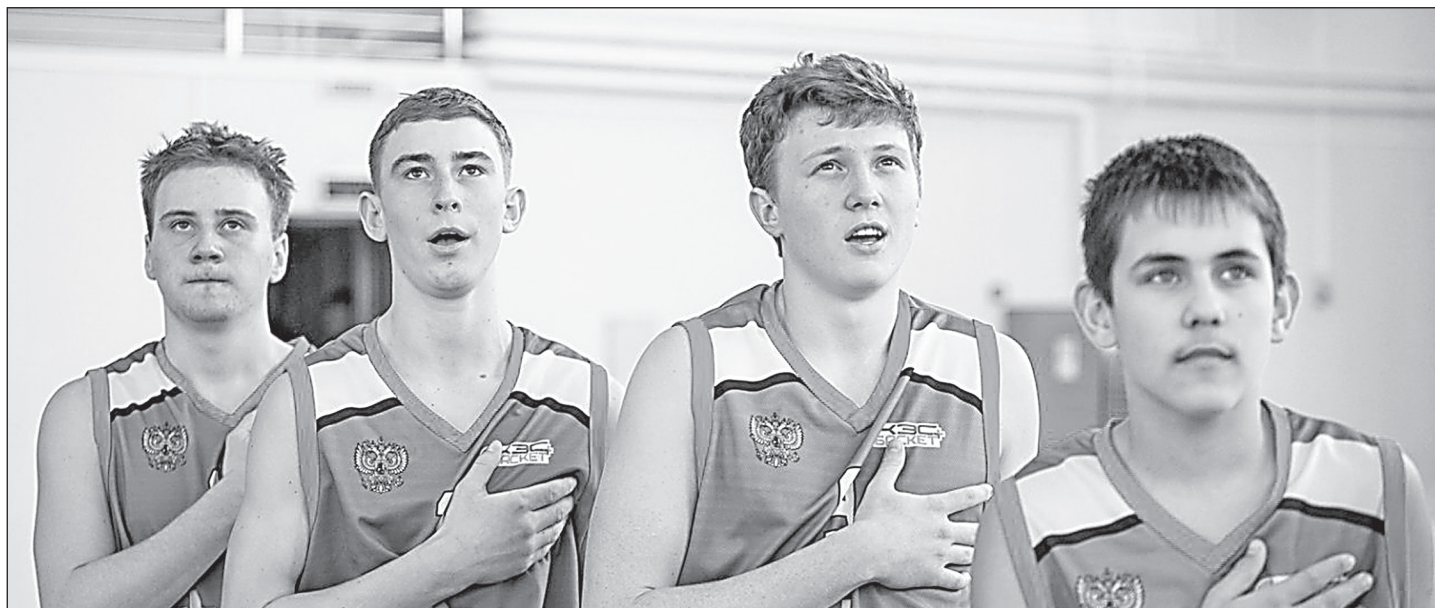
Школьная баскетбольная лига «КЭС - БАСКЕТ»