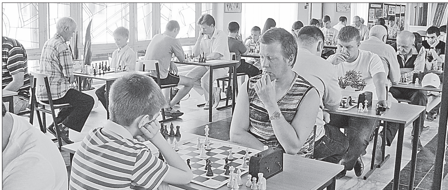
Фестиваль по шахматам им. Михаила Ботвинника, 2012 год