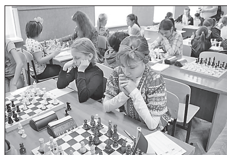
Игровой момент на Всероссийских соревнованиях по шахматам