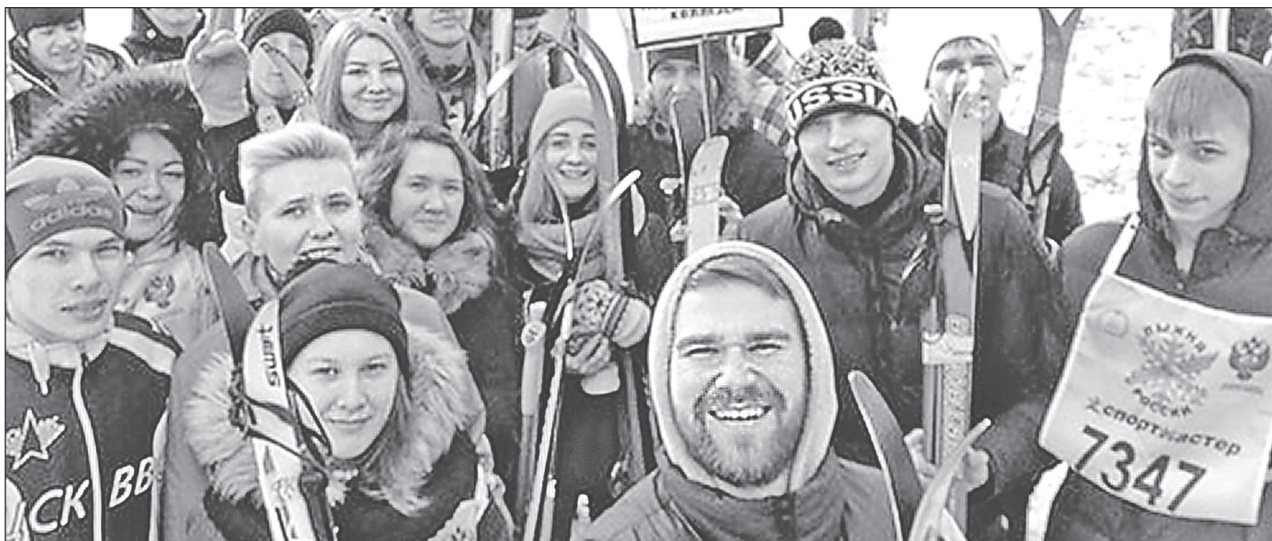
Студенты и преподаватели Тольяттинского социально-педагогического колледжа на Всероссийских соревнованиях «Лыжня России 2016»