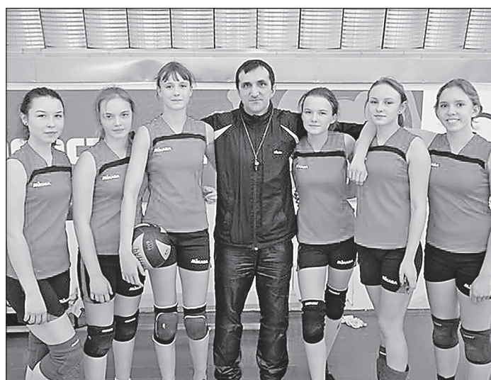
Команда девушек по волейболу ДЮСШ №1 м.р. Ставропольский