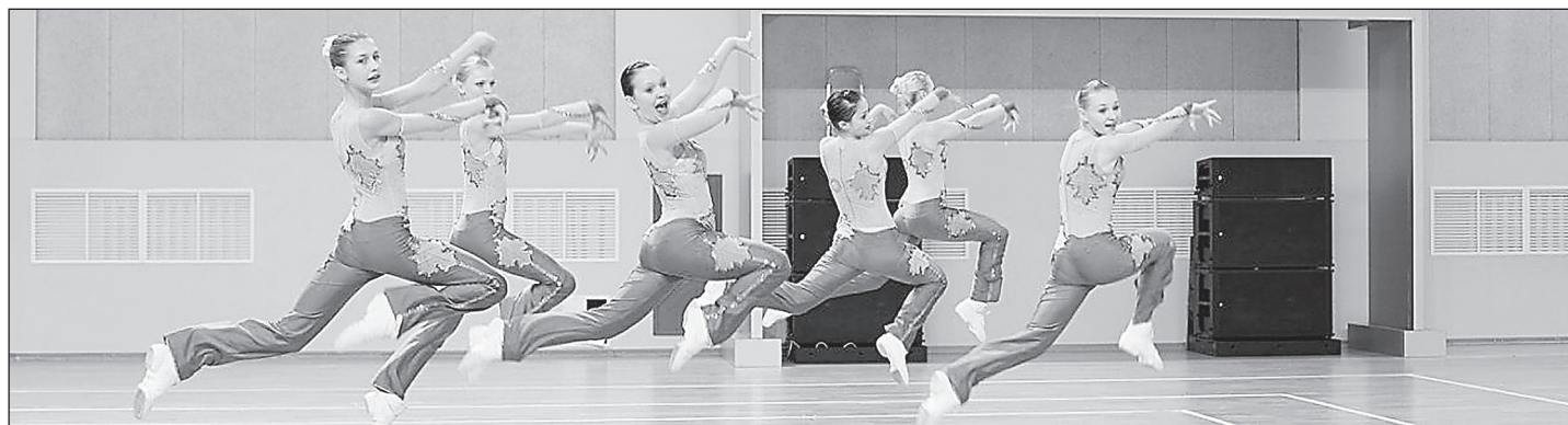
Воспитанницы Кинель-Черкасской ДЮСШ на областных соревнованиях по фитнес-аэробике