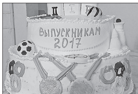
Сладкий сюрприз для выпускников 2017 г. Кинель-Черкасской ДЮСШ