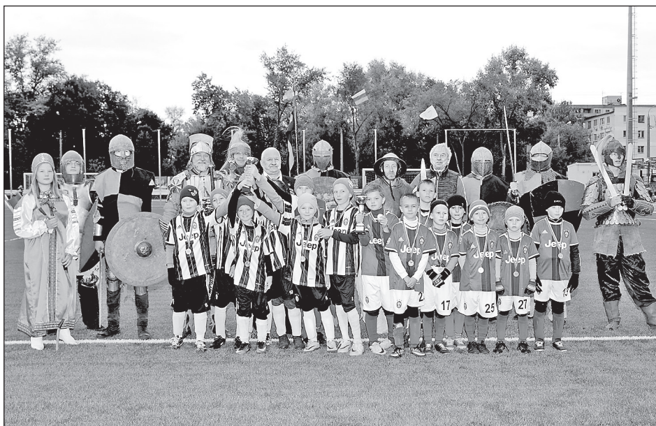
27 сентября 2017 г. на стадионе «Нефтяник» прошёл фестиваль спорта и здоровья «Молодая Россия говорит наркотикам - НЕТ!»