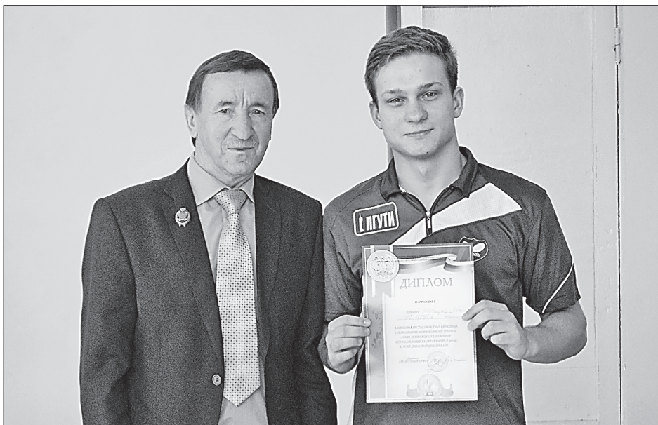
Команды юношей и девушек по настольному теннису колледжа связи ПГУТИ заняли первое место на областных финальных соревнованиях среди обучающихся учреждений профессионального образования, которые проходили в октябре 2017 года

Сборная команда колледжа участвует в различных спортивно-массовых мероприятиях, в таких как «Кросс нации», «Лыжня России», городская легкоатлетическая эстафета, посвящённая дню Победы, районных соревнованиях.