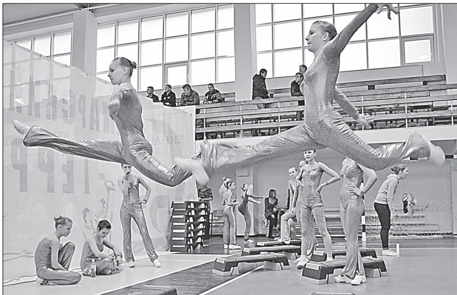
Выступление воспитанниц отделения фитнес-аэробика на областных соревнованиях