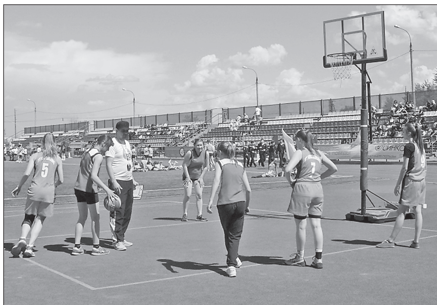
Баскетбольная команда Красноярской детско-юношеской спортивной школы