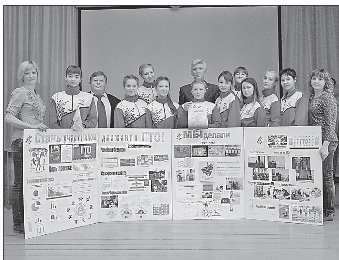
Проект «Стань участником движения ГТО!» Кинель-Черкасской ДЮСШ занял 3 место на XVI Всероссийской акции «Я гражданин России»